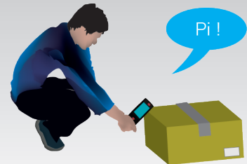
商材に貼付したバーコードを スキャンして貸出・返却