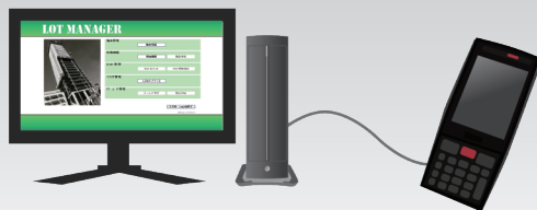
管理 PC と端末のデータを同期